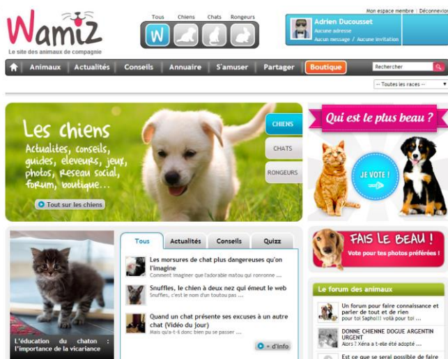
Page d'accueil de Wamiz

aducousset@wamiz.com / Tél : 09 72 30 66 01